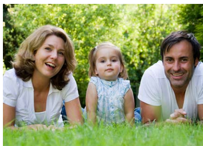
LEBENSPHASEN: Junge Doubles mit Kind – Topzielgruppe für Versicherungsprodukte

„Der Versicherungsschutzbedarf privater Haushalte ist wesentlich von der jeweiligen Lebenszyklusphase und der wirtschaftlichen Leistungsfähigkeit abhängig.“ 1 Neben den Bedarfsdaten bietet die VA zwei geeignete Lebensphasenmodelle für die Zielgruppenselektion: Das klassische Modell der Lebenszyklen